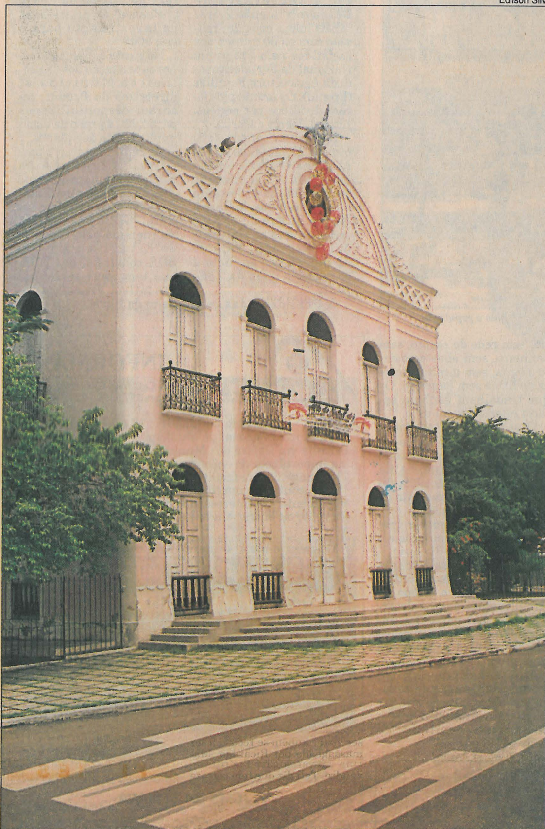
O Teatro São João, de inspiração italiana em estilo neoclássico, faz parte do Patrimônio Cultural Nacional